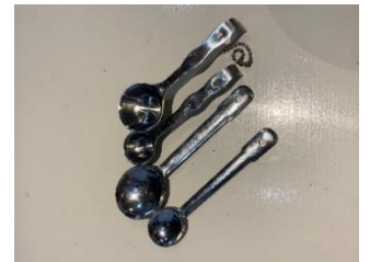
計量スプーン大2本・ 小2本