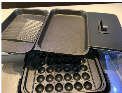
ホットプレート 1 台