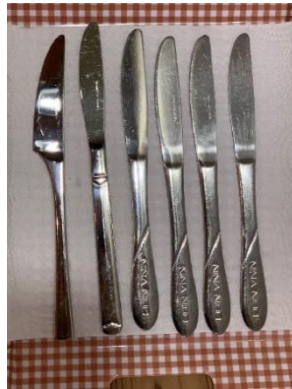
1本 1本 4本