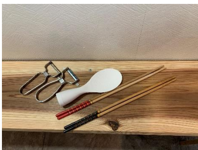
ピーラー2個・菜箸2組・しゃもじ1個