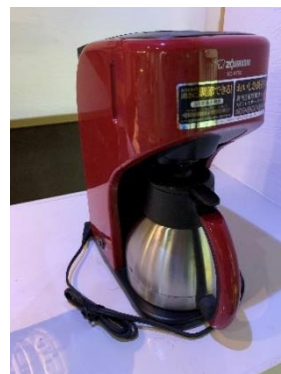
コーヒーマーカー 1 台 (5 杯用)