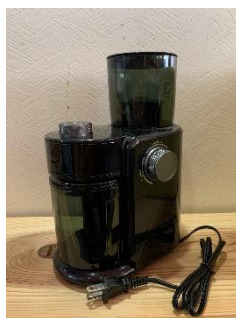
コーヒーミル 1 台