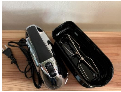
ハンドミキサー1台