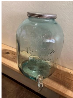
ウォーターポット 1 台