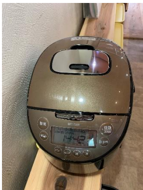
1 升抱き 1 台