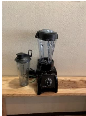
バイタミックス 1 台