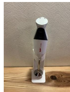
バーミックス 1 台