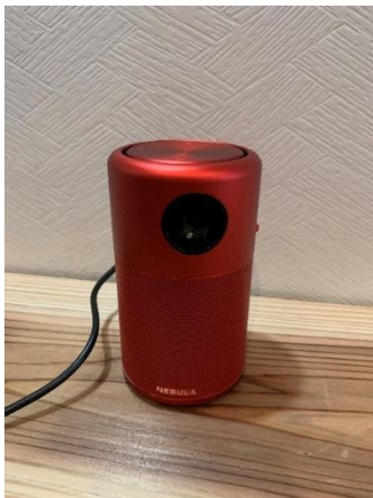
プロジェクター1台