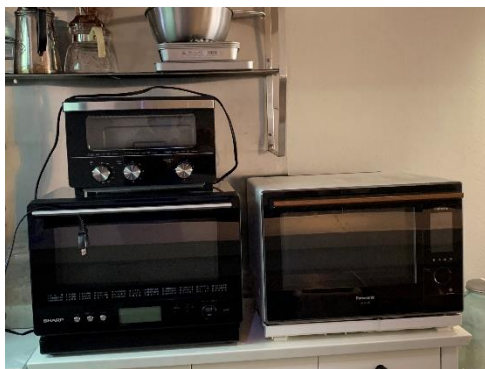
オープンレンジ 2 台