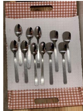
4本 3本 4本