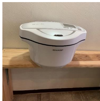
ヘルシオ 1 台