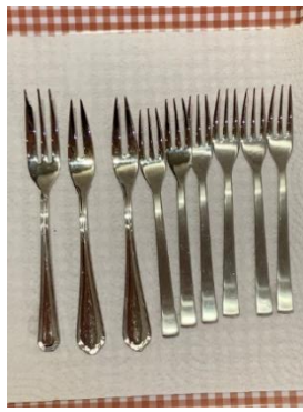
1本 2本 6本