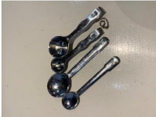
計量スプーン大2本・小2本