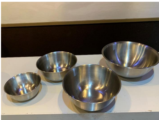
ステンレスボール 4 種類各 1 個