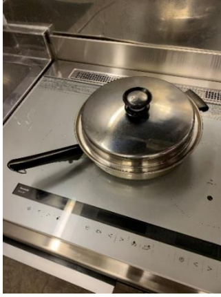
浅型鍋 1 個