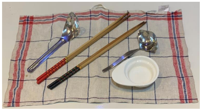
味噌スプーン1・個菜箸2組・ミニお玉1個・&