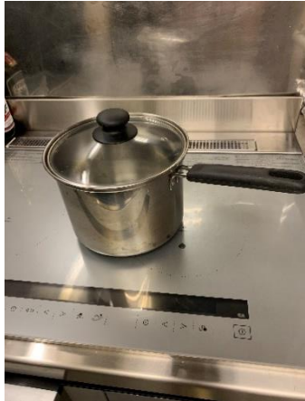
深型鍋Sサイズ 1 個