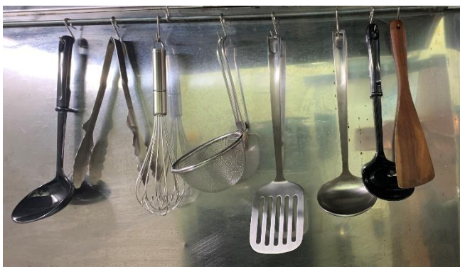
キッチンにぶら下がっている道具