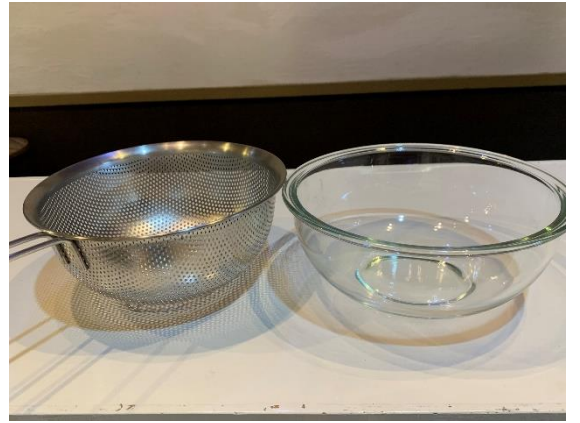
パンチ穴水切り・耐熱ガラスボール各 1 個