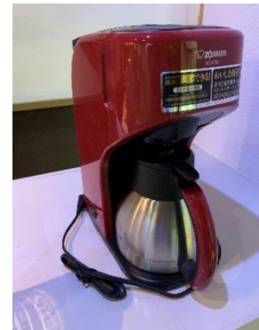
コーヒーマーカー 1 台 (5 杯用)