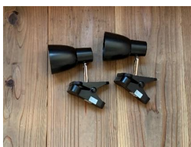
クリップライト 2個