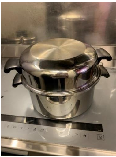
深型鍋Lサイズ 1 個