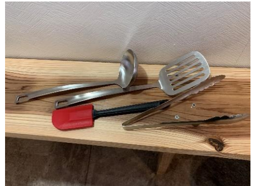
お玉・フライ返し・ゴムべら・トング各1本