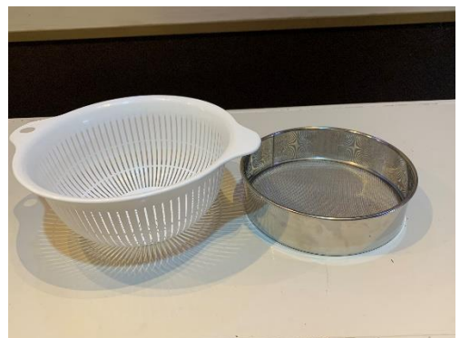
プラスチックザル・粉ふるい各 1 個