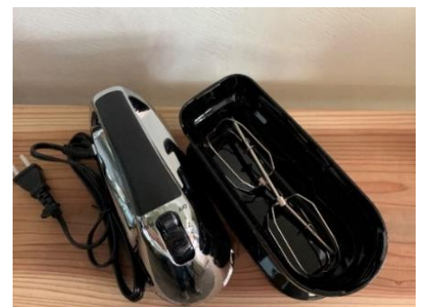
ハンドミキサー 1 台