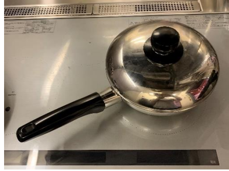
浅型Sサイズ鍋 1 個