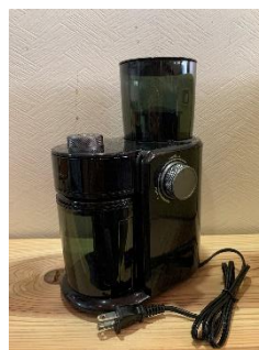
コーヒーミル 1 台