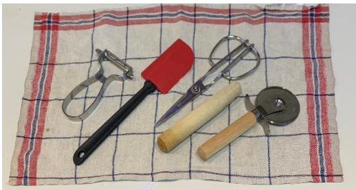
ピーラー2個・菜箸2組・しゃもじ1個