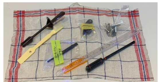
ハンド ミキサーとミキサーの道具 温度計2種類各1本