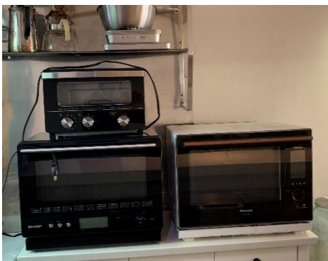
オープンレンジ 2 台